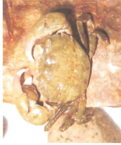
タカノケフサイソガニ