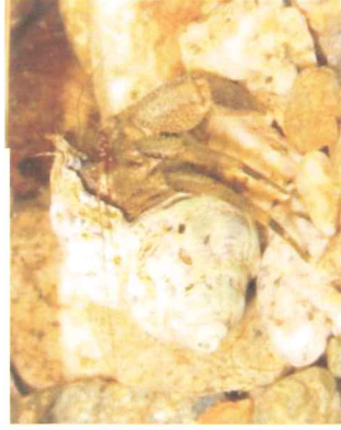
ユビナガホンヤドカリ