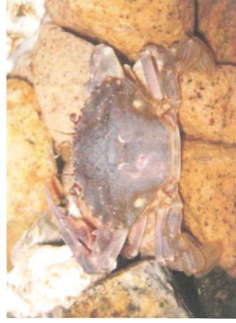
イシガニ（こうらは7cmくらい）