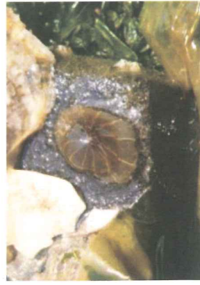
タテジマイソギンチャク